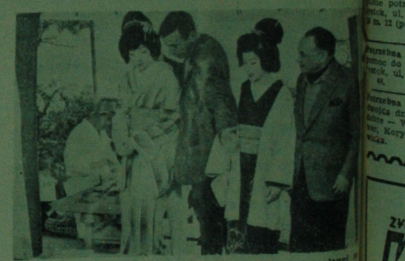
NA ZDJĘCIU: scena z filmu „Gejsza”. Pierwszą z lewej jest Shirley MacLaine... NA ZDJĘCIU: scena z filmu „Gejsza”. Pierwszą z lewej jest Shirley MacLaine...