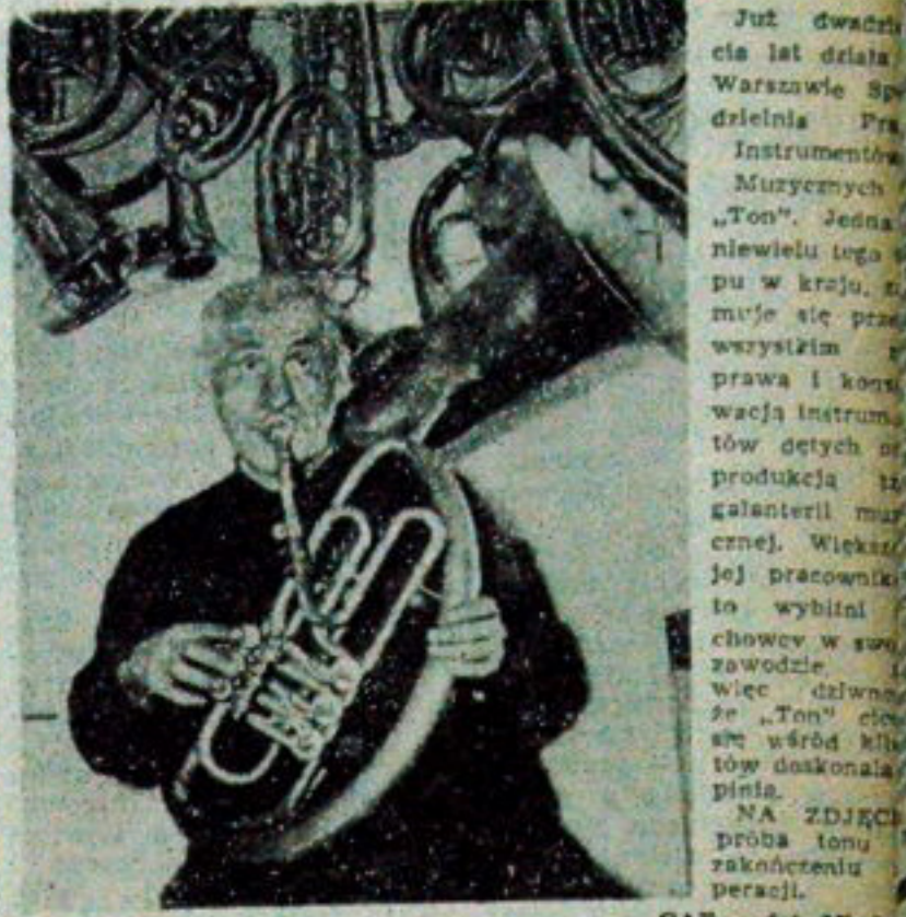
CAF — fot. Miedz

Zasadnicza Szkoła Zawodowa w Szczepanie szkol. m. in. maszynistki biurowe. Wprowadzono tu m. in. tzw. zdobnictwo maszynowe. Polega ono na tym, że na maszynie do pisania wykonuje się różnego rodzaju wzór — postać, ornamentów itp. niejednokrotnie pomysłów w zależności od fantazji oraz stopnia opanowania maszyny. (PAP)