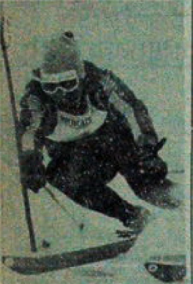
NA ZDJĘCIU: jeden z najlepszych „alpejczyków” świata, Francuz Lacroix na trasie slalomu-giganta.

TOTO-LOTEK 12, 21, 22, 23, 37, 41 dod. 2.