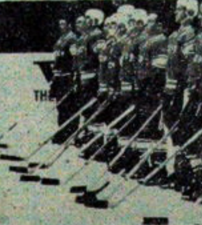
NA ZDJĘCIU: hokeiści ZSRR.

świata w Finlandii. Hokeiści ZSRR zdobyli tytuł najlepszych na świecie już po raz piąty. Dotychczas triumfowali oni w 1954 r., 1956 r., 1963 r. i w 1964 r. Największe znaczenie miał sobotni mecz ZSRR — CSRS.