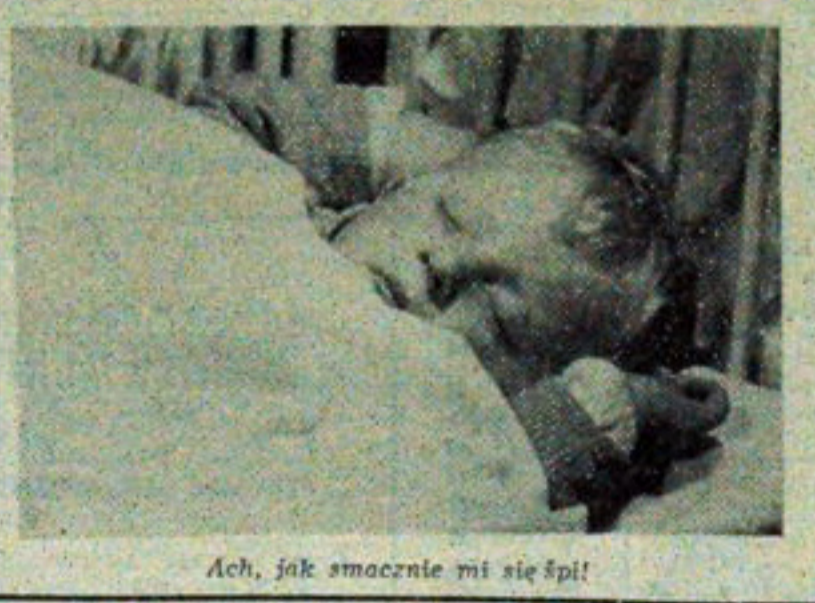
Ach, jak smacznie mi się śpi!