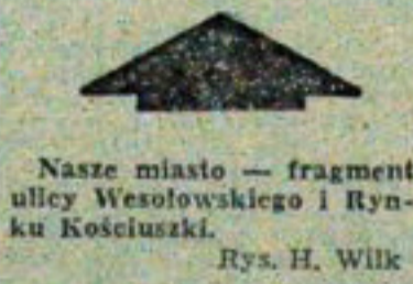
Nasze miasto — fragment ulicy Wesolowskiego i Rynku Kościuski. Rys. H. Wilk

W pierwszych dwóch miesiącach roku realizacja świadczeń na Społeczny Fundusz Budowy Szkół przebiega w Białymstoku pomyślnie. (as)