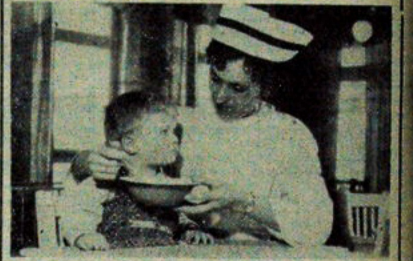
Posilek jest smaczny, ale w jedzeniu musi pomóc nam jeszcze pani.