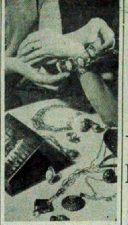
Warszawska spółdzielnia me- taloplastykowa „Orno”, powsta- ła 15 lat temu i zajmuje się produkcją biżuterii ze srebra. Tą piękną dziedziną, zaintereso- wani są grupa uczniów warszaw- skich. Spółdzielnia wyko- nuje biżuterię i przedmioty de- koracyjne i użytkowe.

technicznych i maszynowych branżach tego przemysłu sporządzono już plany kon- centracji produkcji, programy specjalizacji zakładów i zjednoczeń, pełniejszego niż dotąd wykorzystania zdol- ności wytwórczych w okre- sie przyszłego pięciolatki.