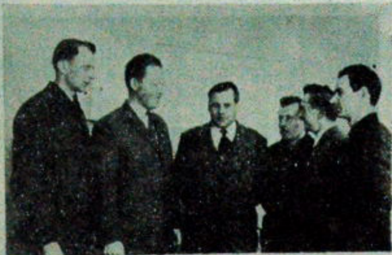
NA ZDJĘCIU: Brygada Pracy Socjalistycznej Centrali Nasiennej w Mońkach...