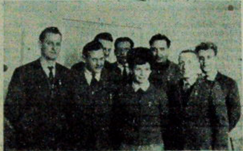
NA ZDJĘCIU: Brygada Pracy Socjalistycznej z Grajewą.