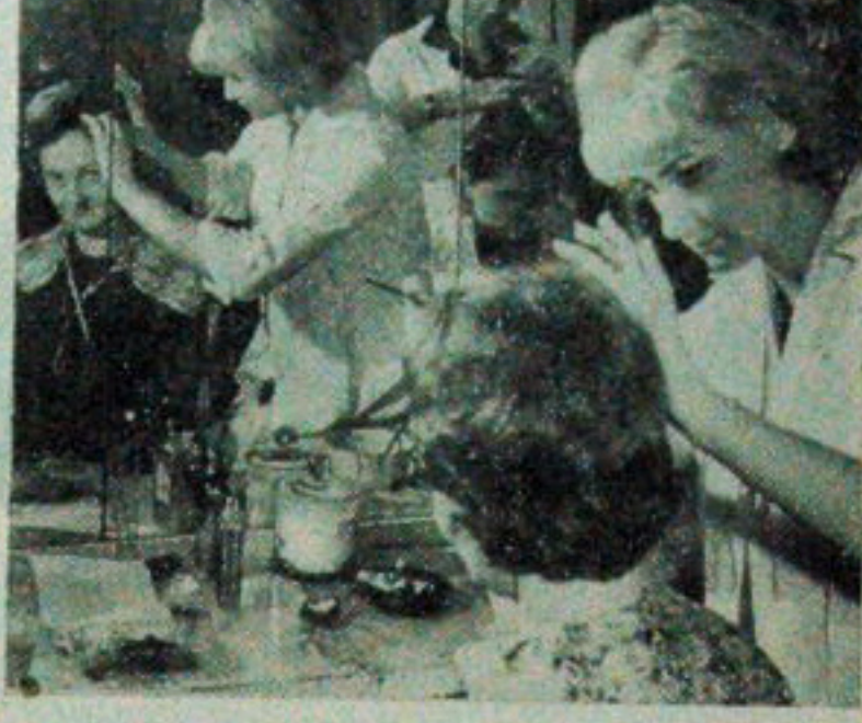
Przy Zakładach Przemysłu Bawełnianego im Mar- chlewskiego w Łodzi — jest to jedna z największych fabryk przemysłu włókienniczego w Polsce — Spół- dzielnia „Uroda i Zdrowie” uruchomiła bardzo dobrze wyposażony salon kosmetyczny i fryzjerski. Korzysta z niego miesięcznie ponad 600 kobiet, pracownic zak- ładowo. NA ZDJĘCIU: z tak uczesaną głową randka uda się na pewno...