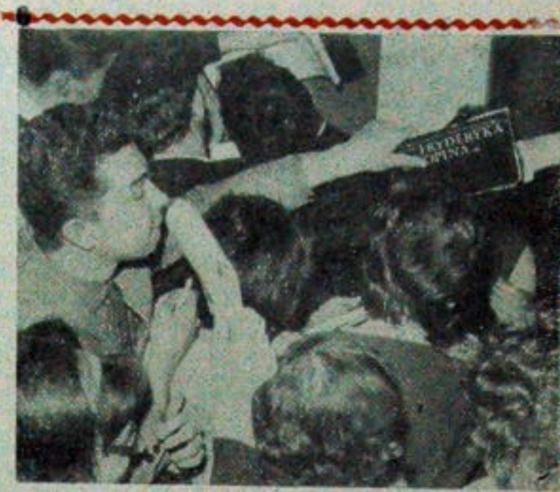
Z VII Międzynarodowego Konkursu Chopinowskiego w Warszawie.

KOSZALIN (PAP) — Mieszkańcy Koszalina starodawnej ognis osady kaszubskiej, obchodzą uroczystie 20-lecie wyzwolenia swego miasta. Zdobyli go 4 marca 1945 r. w ciężkich walkach wojska III korpusu pancernego gwardii wchodzącego w skład II frontu. Z okazji 20 rocznicy wyzwolenia miasto przybrało odświętny wygląd.