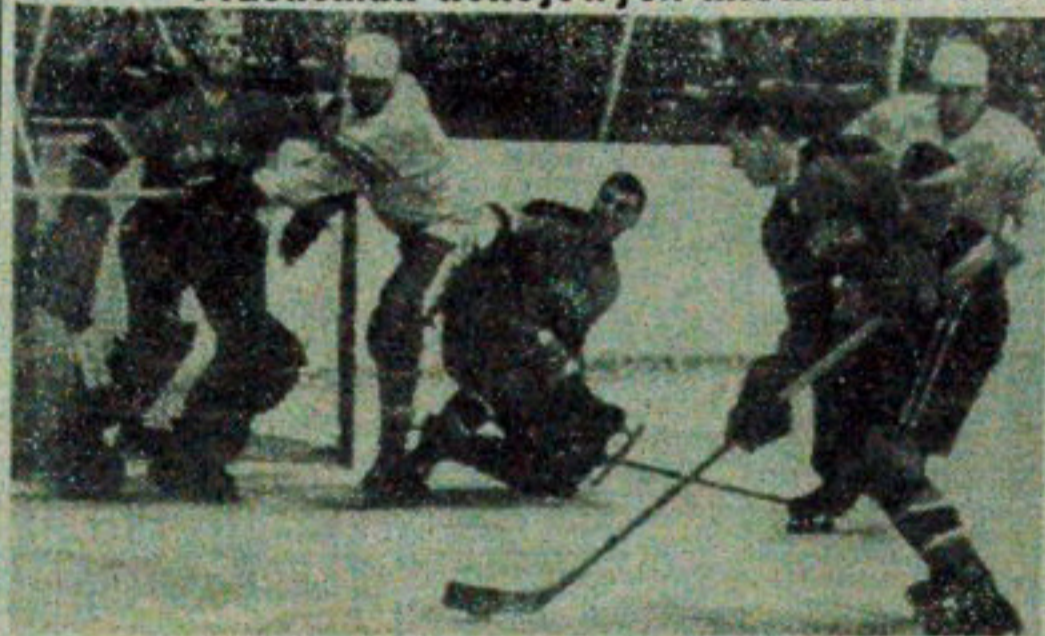
NA ZDJĘCIU: fragment piątkowego meczu hokejowego ZSRR — Kanada, rozegranego w Moskwie. Zwyciężyli hokeiści radzieccy 3:1 (2:1, 1:0, 2:0). W obu reprezentacjach zabrakło wielu zawodników, przewidzianych na mistrzostwa świata w Finlandii.