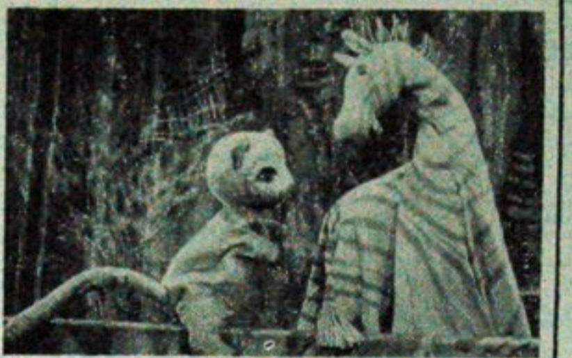
NA ZDJĘCIU: scena z przedstawienia.