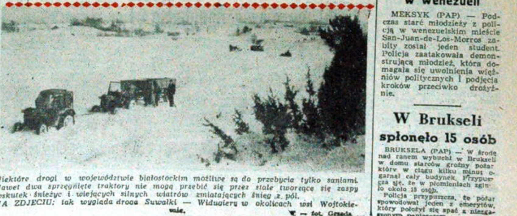
Niektóre drogi w województwie białostockim możliwe są do przebycia tylko saniami. Nawałet dwa sprężnięte traktory nie mogą przebić się przez stale tworzące się zaspę wskutek śnieżyce i wlejących silnych wiatrów zmiatających śnieg z pól. NA ZDJĘCIU: tak wygląda droga Suwałki — Widuajery w okolicach wsi Wojskowie. — fot. Grzela

BRUKSELA (PAP) — W środę nad ranem wybuchł w Brukseli w domu starców groźny pożar, który w ciągu kilku minut ogarnął cały budynek. Przypuszczają, że w płomieniach zginęło około 15 osób. Policja przypuszcza, że pożar spowodował jeden z emerytów, który położył się spać z niezgaszonym papierosem.