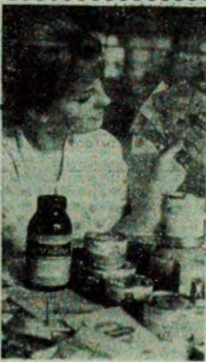
Koncentraty spożywcze powoli, ale systematycznie zdobywają coraz większe uznanie w naszych codziennych jadłospisach. Jednym z zakładów produkujących tego typu wyroby są Opolskie Zakłady Koncentratów Spożywczych.

„Pływające fabryki” z Gdyni pozostaną na północnoatlantycznych łowiskach aż do końca kwietnia. (PAP)