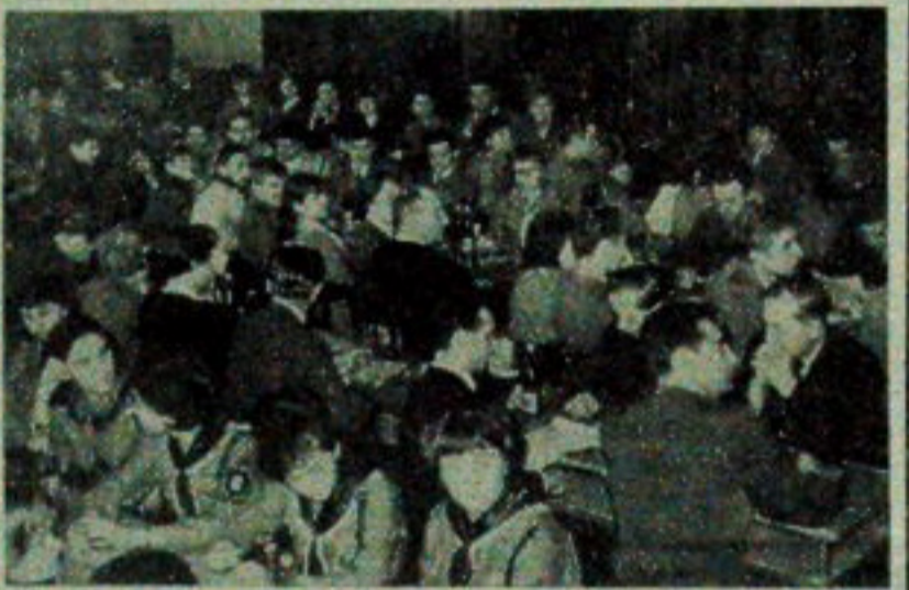
NA ZDJĘCIU: fragment sali obrad.

Uczestnicy obrad dokonali wyboru Rady Hufca, która powołała ze swego gro-