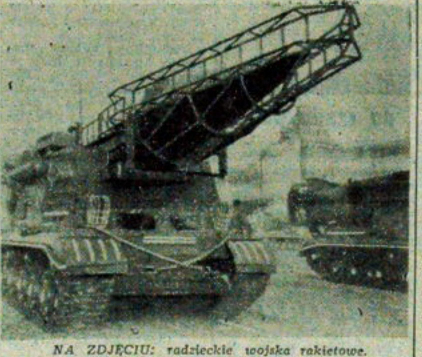
NA ZDJĘCIU: radzieckie wojska rakietowe.

22.11. — zachmurzenie niewielkie, w południe wiaty silniejsze i ostry mróz. Temperatura maksymalna — 3 st. Wiaty umiarkowane, północno-zachodnie. Śnieg zamiecie.