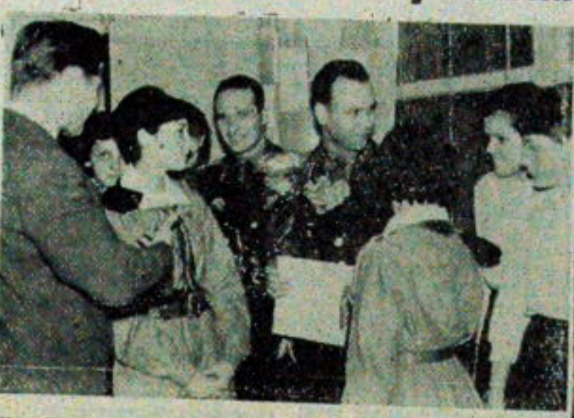
NA ZDJĘCIU: oficerowie radzieccy w otoczeniu młodzieży.

W sobotę, w gmachu Związku Zawodowych w Białymstoku, odbyła się uroczysta wieczornica poświęco-