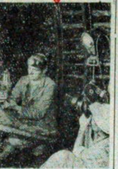
NA ZDJĘCIU: filmowcy przy pracy.

NOWY JORK (PAP) — Przed otwarciem Muzeum Historii Naturalnej w Nowym Jorku kilkadziesiąt osób czekających w tożym było świadkami krwawej sceny. Pewna małżonka, która przybyła z 12-letnią córką, wyczerpała siły i, czy dziecku po gwałtownym zwłódnieniu