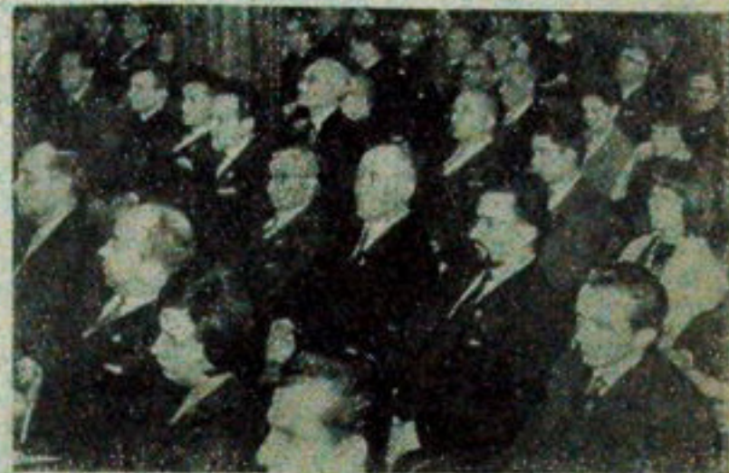
NA ZDJĘCIU: delegacja białostockiej organizacji SD na sali obrad Kongresu.

WARSZAWA (PAP) — W środę po południu zakończył 3-dniowe obrady VIII Kongres Stronnictwa Demokratycznego. W tym dniu dokonano wyboru naczelnych władz SD — Centralnego Komitetu, Centralnej Komisji Rewizyjnej oraz Centralnego Sądu Stronnictwa. W oparciu o przygotowane na Kongres materiały, wygłoszone referaty i sprawozdania oraz trwającą przez 3 dni dyskusję, podjęto uchwałę wytyczającą kierunki prac i rozwoju Stronnictwa na okres następnych 4 lat. Kongres dokonał również zmian w statucie SD.