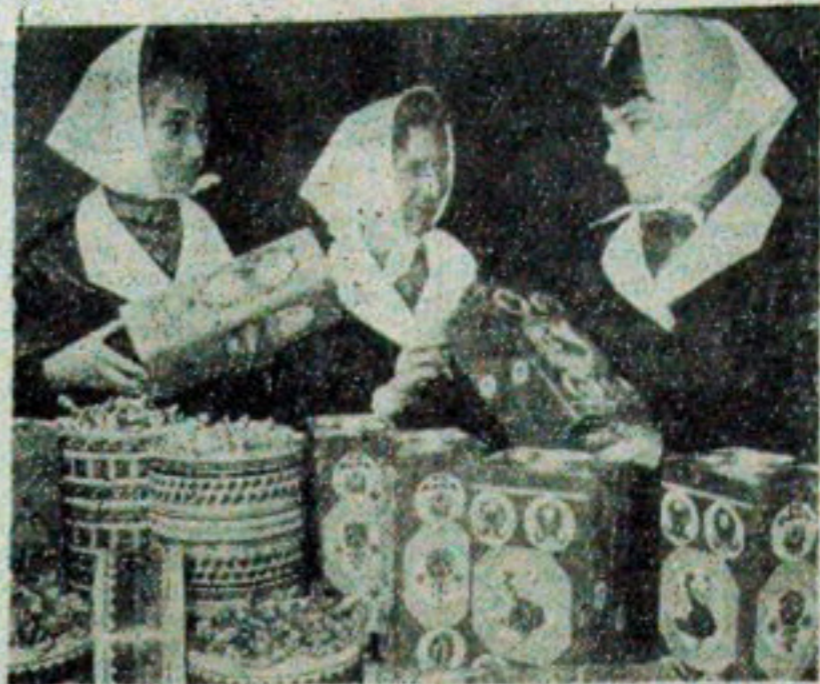
We Włocławku oddana została do eksploatacji najnowsza w kraju wytwórnia cukierków „Spoleczność”. Inwestycja ta kosztowała ponad 100.000.000 zł. W nowym zakładzie wszystkie procesy technologiczne są całkowicie automatyzowane. Roczna zdolność wytwórcza wyniesie 10.200 ton cukierków w różnych gatunkach wartości około 200.000.000 zł. NA ZDJĘCIU: w pakowani gotowych wyrobów.