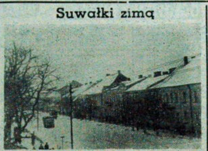
NA ZDJĘCIU — centrum Suwałk w zimowej szacie.