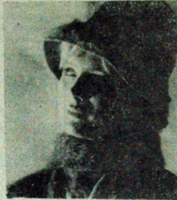
„Portret łomżyńki” — fotogram p. Loryńczy.