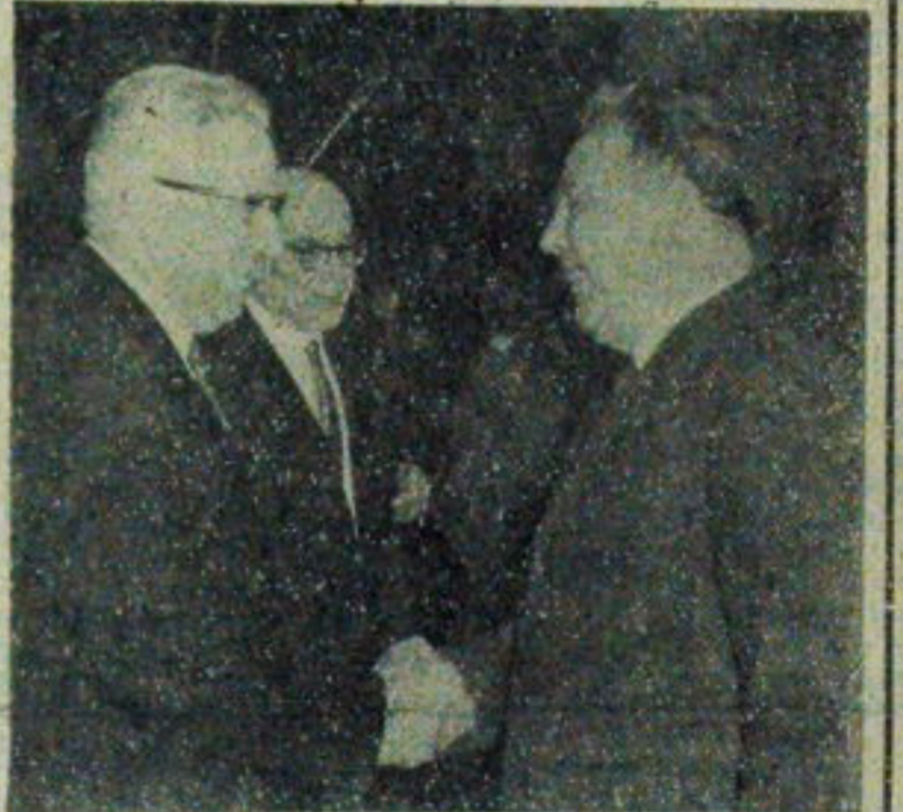
Dnia 19 bm. w godzinach wieczornych przewodniczący Rady Państwa Edward Ochab wyjął przyjęcie na cześć delegacji zagranicznych biorących udział w obradach Doradczego Komitetu Politycznego Państwa Uczestników Układu Warszawskiego. NA ZDJĘCIU: E. Ochab (z lewej) witający przybyłego na przyjęcie I sekretarza KC KPZR L. Breżniewa. Drugi od lewej — I sekretarz KC PZPR — Wł. Gomułka.

MOSKWA (PAP) — Przewodniczący Prezydium Rady Najwyższej ZSRR, A. Mikojan i przewodniczący Rady Ministrów ZSRR, A. Kosygin, wystosowali do prezydenta Stanów Zjednoczonych, Lyndona Johnsona depeszę z gratulacjami i życzeniami z okazji oficjalnego objęcia przez niego funkcji prezydenta Stanów Zjednoczonych.