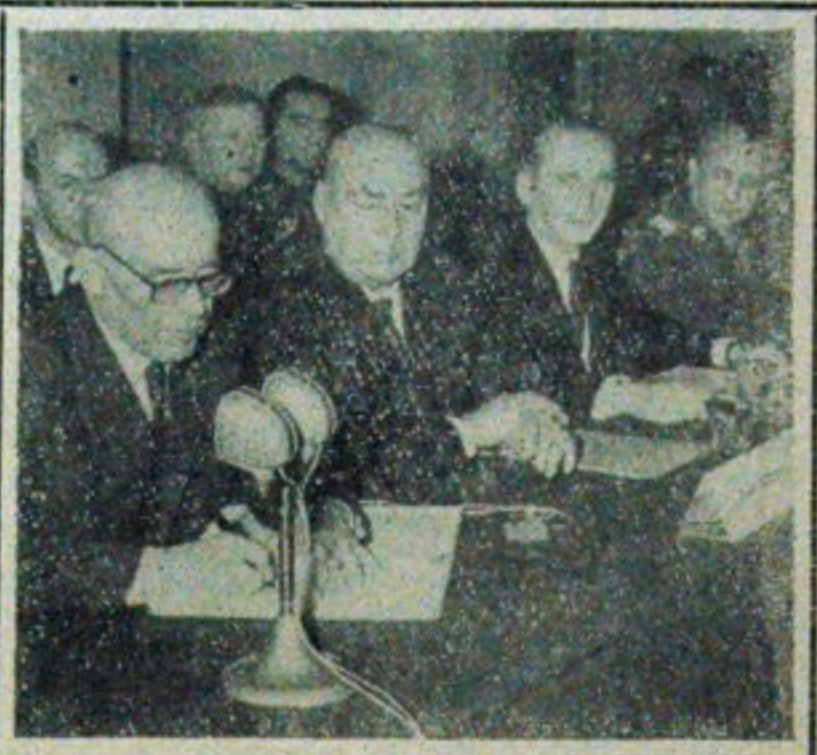
Dnia 20 bm. w Urzędzie Rady Ministrów w Warszawie odbyło się końcowe posiedzenie Doradczego Komitetu Politycznego Państwa Uczestników Układu Warszawskiego o Przyjaźni, Współpracy i Pomocy Wzajemnej. Zakończenie obrad nastąpiło ok. godz. 18, po czym odbyło się uroczyste podpisanie komunikatu o przebiegu obrad. Dokumenty podpisywali pierwsi sekretarze komitetów centralnych partii komunistycznych i robotniczych oraz szefowie rządów państw uczestników Układu Warszawskiego. NA ZDJĘCIU: I sekretarz KC PZPR Władysław Gomułka podpisuje końcowy komunikat.

HANOI (PAP) — Jak podała rozgłoszenia Patet Lao w ośrodku wyzwolonych obszarów Laosu, Khang Khayu odbył się wiec protestacyjny przeciwko rozszerzaniu przez Stany Zjednoczone i ich zwolenników działań wojskowych w Laosie. Uczestnicy wiecu żądali, aby Amerykanie i ich slugi niezwłocznie zaprzestali prowokacji oraz bombardowania i ostrzeliwania rejonów wyzwolonych. Podobne wiece odbyły się ostatnio w Muong-Son i Muong-Say.