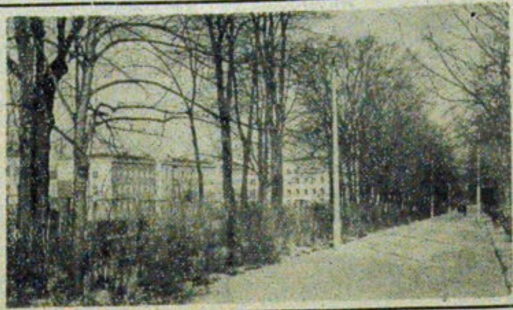
Planty w zimowej szacie. Widok alei biegącej od ul. Mickiewicza do ul. Akademickiej.

S zczędności, chociaż jeszcze nieduże, jednak w ogólnym rachunku już coś znaczą. Podobne rezerwy tkwią na pewno i w innym przedsiębiorstwie - MPK, do którego trzeba dopłacać aż 17 mln zł. Szukanie sposobów oszczędnego gospodarowania - to zadanie wszystkich pracowników przedsiębiorstwa, bez względu na stanowiska jakie zajmują. (as)