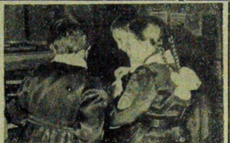
Zbliża się szkolne półroczne. Siąd też uczniowie wszystkich szkół „przysiadają faldów”, aby mieć najlepsze oceny.

Plną sprawą jest także konsolidowanie na ogół niezdolnej i podniesienie kwalifikacji zawodowych. Dużo miejsca poświęcono zagadnieniom usprawnienia organizacji pracy. Również omawiano zadania na bieżący rok. W warunkach tego zakładu są duże i odpowiedzialne. Chodzi bowiem o to, by w przyszłości przeprowadzić produkcję pasz wysokobiałkowych, na które czekają nasi rolnicy. (bn)