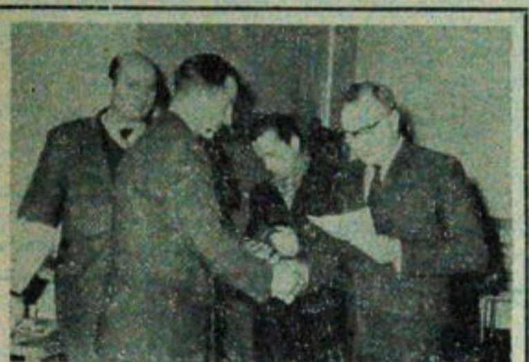
Ostatnio Wydział Komunikacji Prezydium WRN i Państwowy Zakład Ubezpieczeń zorganizowały bardzo przyjemną uroczystość. Poza przedstawicielami władz uczestniczyli w niej zawodowi kierowcy samochodowi z całego naszego województwa. Przewodzący z nich zostali nagrodzeni. NA ZDJĘCIU — przedstawiciel PZU wręcza nagrody. Fot. A. Zdr.

Koło Rodzin Wojskowych istniejące przy Podlaskiej Jednostce KBW zorganizowało karnawałową zabawę maluchów. W czasie imprezy dzieci wykonywały inscenizację zbiorową oraz deklamowały wiersze. Maluchy otrzymały słodycze, zabawki i książki. Do tańca przygotowała orkiestra Podlaskiej Jednostki KBW. Tekst i zdjęcie: Henryk Okuniewicz