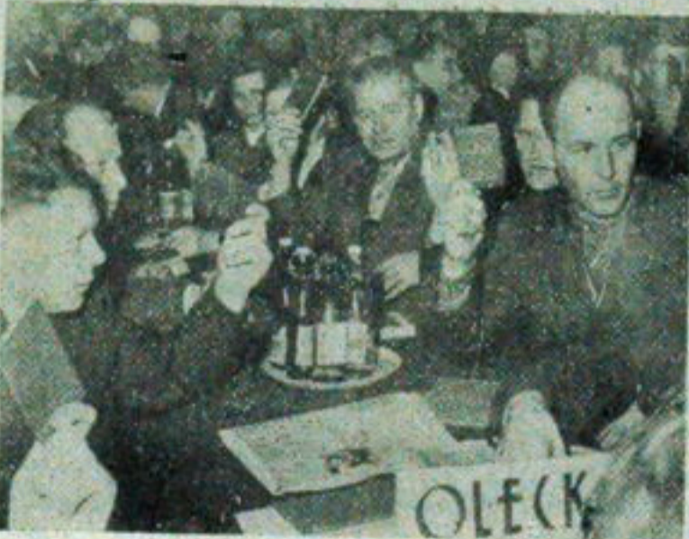
NA ZDJĘCIU: fragment sali obrad.