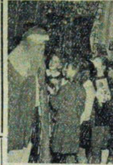
Dzieciom do tańca przygotował własny, doskonały zespół mandolinistów.

Z Mikołajem rozmowa toczyła się w serdecznej i bezpośredniej atmosferze.