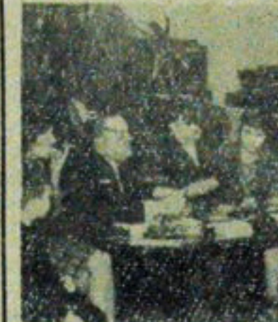
Uczestnicy konkursu zastanawiają się nad odpowiedziami.

SPÓLDZIELCZY Dom Kultury Dziecka przy ulicy Kilińskiego zorganizował ostatnio dwudniową imprezę noworoczną dla dzieci. Organizatorzy zadbałi nie tylko o wesołą zabawę, lecz zatroszczyli się także o urozmaicony i ciekawy program zajęć. Odbłyły się między innymi konkursy i zgaduj-zgadule na tematy ruchu drogowego, grzeźności na co dzień, muzyki i higieny osobistej. Dzieci przez dwa dni miały doskonałą rozrywkę. (L)