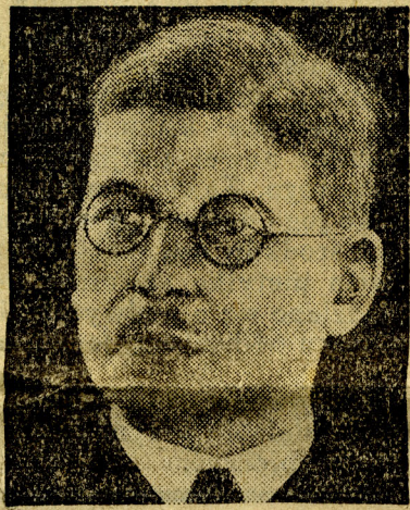
Kancelarz Schuschnigg, o którym piszemy na str. 2-cj.

ty przed paru dniami przez wojska włoskie. Debra-Markos jest stolicą Godzanu. Od działy wojsk włoskich ruszyły przez góry na zajęcie całej prowincji. Wodzowie oddziałów rasa Imru złożyli akt uległości wobec władz włoskich.