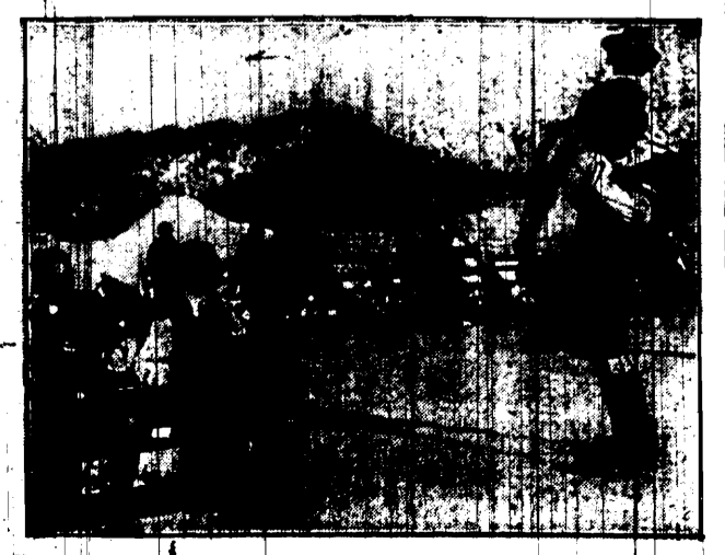
Konkurs tańca lodowego w słynnym uzdrowisku szwajcarskim St. Moritz.