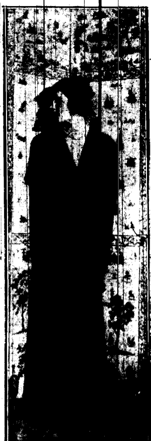
Oryginalnie skrojona sukienka popołudniowa z czarnego, lśniącego jedwabiu. Piękny kapelusik fiowy.