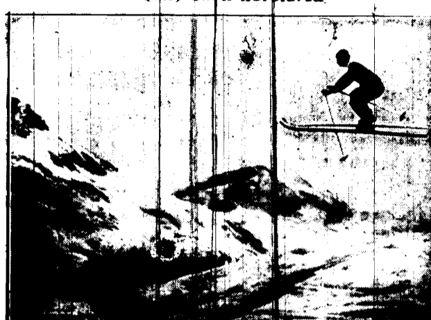
Ciekawy moment z zawodów narciarskich w St. Moritz.