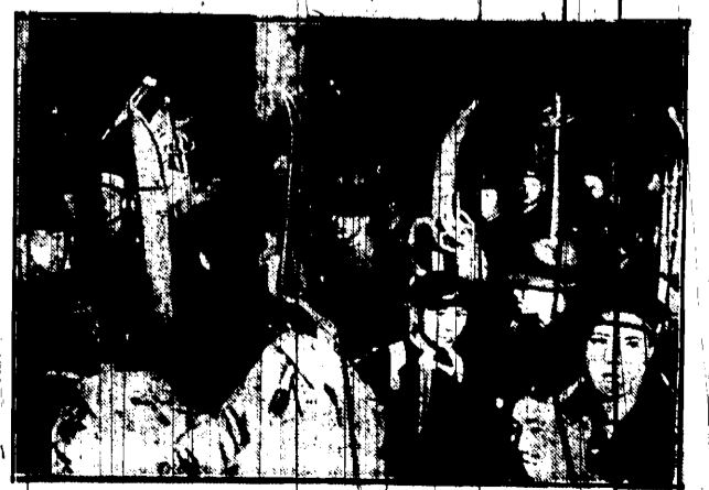
Tham wyjeżdżających w góry, narciarzy na stacji Uno w Tokio.