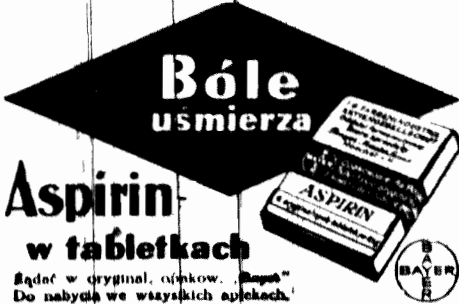
Bóle usmierzają Aspirin w tabletkach. Sądąc w oryginalnym opakowaniu. Do nabycia we wszystkich aptekach.

miotem obrad Rady Miejskiej, jednakże projekt nazw, opracowany przez Wydział Techniczny, nie znalazł aprobaty Rady Miejskiej. Nazwy dostosowane zostaną do warunków historycznych i lokalnych