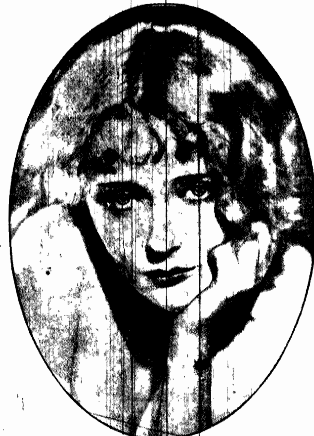
Czemu taka smutna? Czy on ją porzucił, czy krawcowa mu odesłała na czas sukienki?