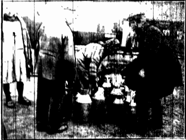
Uważają, że wierzawicy nie poznają się na tem, gospodarze okolicznych wsi na dworcu kolejki dojazdowej w Plaszczynie uzupełniają wylane w drodze mleko wodą.