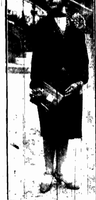
Na balu w charytatywnym celu, który przywodził do siebie w Warszawie, w wypadkach wyjątkowych, chętnie pojechał swego