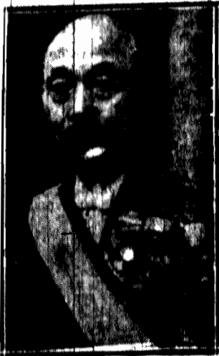
Ambasador Japonji w Paryżu, będzie przewodniczył Radzie Ligi Narodów na sesji w Madrycie.