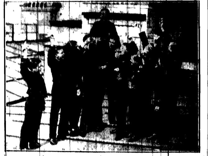
Wielki koncert z okazji 10-tych rocznic...