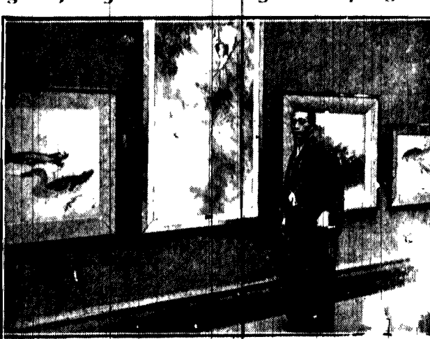
Znakomity malarz japoński Todo wystąpił w Paryżu z własną wystawą...