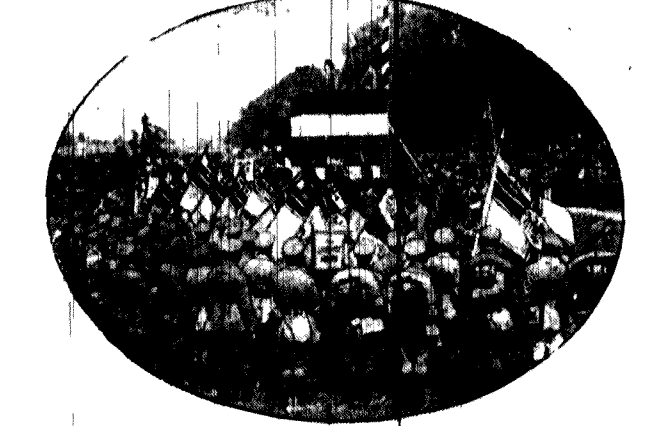
na wielkim zjeździe niemieckich organizacji wojskowych w Monachium.