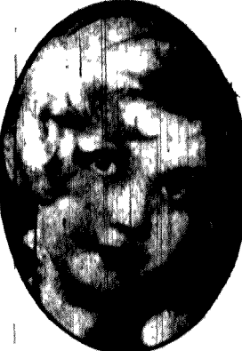
Oczy, jak migdałki słodka.