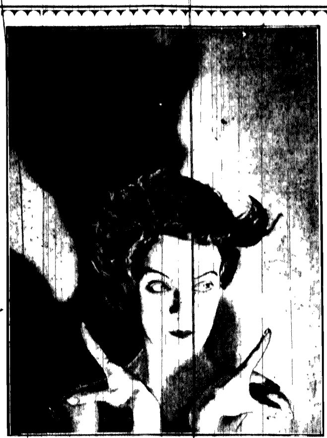
Jaka tajemnicą intriguje ten piękny djabelek?