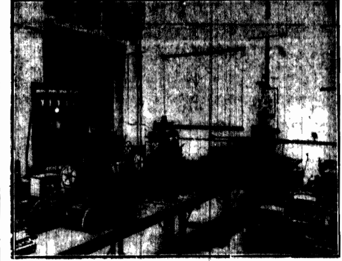
Centrala telegraficzna, z której na cały świat wysyłane będą wiadomości o wynikach posiedzeń.