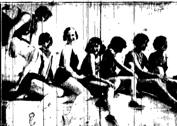
Zdjęcie migawkowe w upalny dzień berliński nad brzegami jeziora Wannsee.