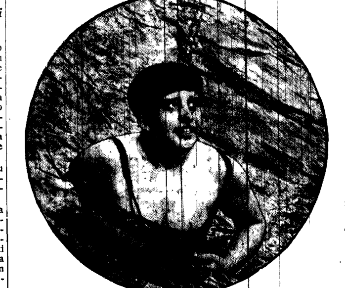
Na bystre nurty Wisły wyruszyła członkini warszawskiego Klubu wioślarek, mieszczącego się opodal mostu Poniatowskiego.