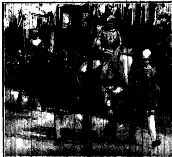
Mieszkańca Orléansu w stroju historycznym, wita podchód historyczny, urządzony na pamiątkę pięćsetlecia uwolnienia miasta od najeźdźców przez Joannę.