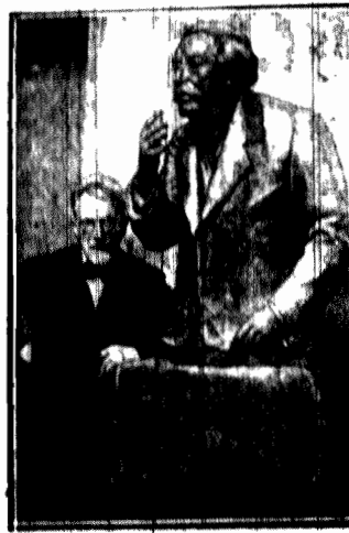
Ostatnie zdjęcie znakomitego rzeźbiarza francuskiego Guillaume'a Rzeźba, ujmująca charakterystyczny gest Brianda, jako mówcy wielkiego wojownika pokoju