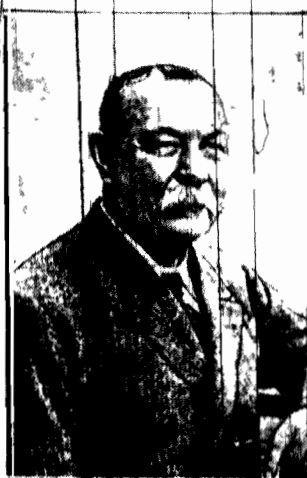
Słynny powieściopisarz angielski, twórca postaci Sherlocka Holmesa — króla detektywów i głowa snajperystów angielskich, obchodzi 70 rocznicę urodzin.