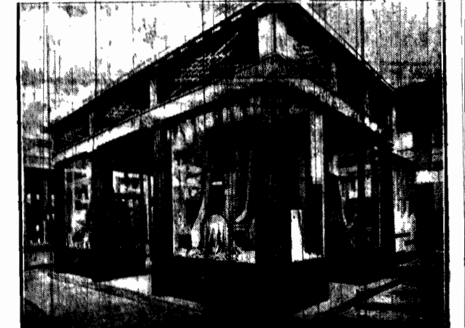
Pawilon fabryki Biedermanna z Łodzi