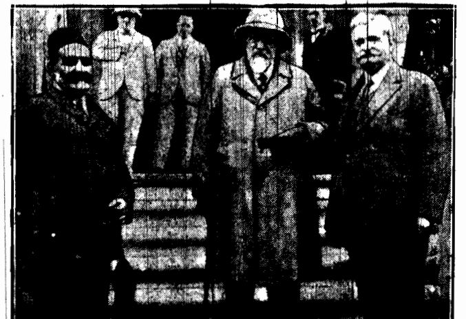
Były władca Bułgarii w drodze powrotnej ze swej podróży na wschód zatrzymał się w Kairze. Na zdjęciu widzimy go przed hotelem w białym tropikalnym.