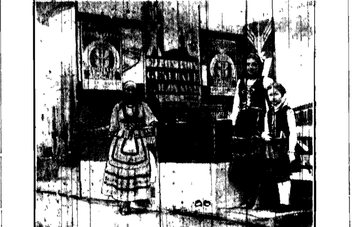
Je dorocznym targach paryskich (tzw. „Foire de Paris”) ogólna wzbłąg zwraca blickny pawilon, reklamujący Państwowa Wystawa Kralowa w Poznaniu.