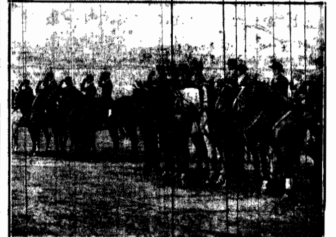
Prezentacja drużyn: amerykańskiej, rumuńskiej i węgierskiej przed Prezydentem Rzeczypospolitej.