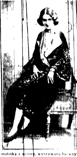
matinka z wiersza, wyszywana barwnym deseniem.