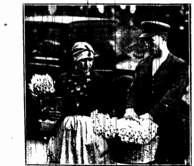
Narcyzy! świeże narcyzy! Białe wonne kwiaty, sprzedawane na ulicach Warszawy, wabią oczy przechodniów urokiem wiosennym. I wkrótce znikną z koszyka sprzedawcy, chociaż są drogie.