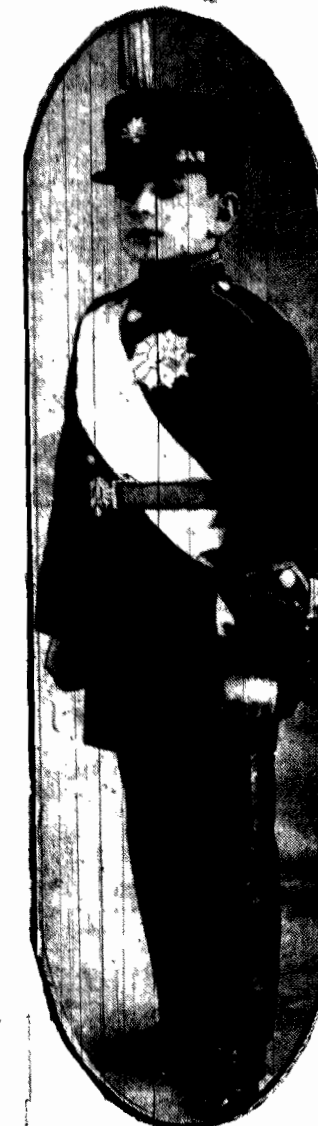
Ned Reza, przywdział niedawno po raz pierwszy strój, w którym w przyszłości będzie spełniał władzę nad Persją.