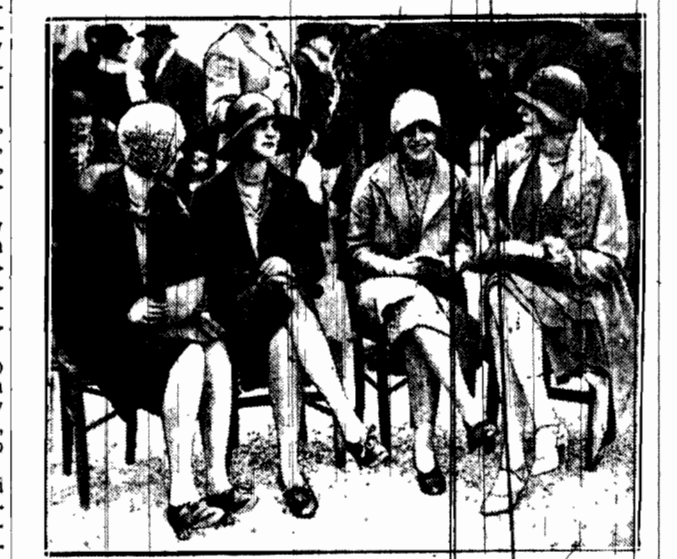
Na wyścigach konnych w Longchamp pod Paryżem rozstrzygano konkurs o dwie nagrody elegancji i mody. Defilada elegantek w najnowszych tworach paryskich krawców, trwała kilka godzin. Oto jedna z grup konkurencyjnych.