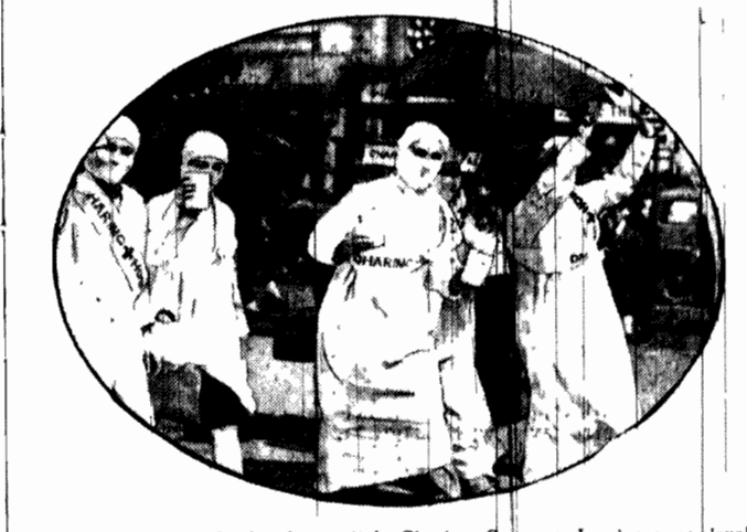
Celem zwiększenia funduszy szpitala Charing Cross w Londynie, studenci medycyny w strojach z sali operacyjnej wyruszyli na ulice stołecz Anglii, urządzając zbiórkę wśród przechodniów.