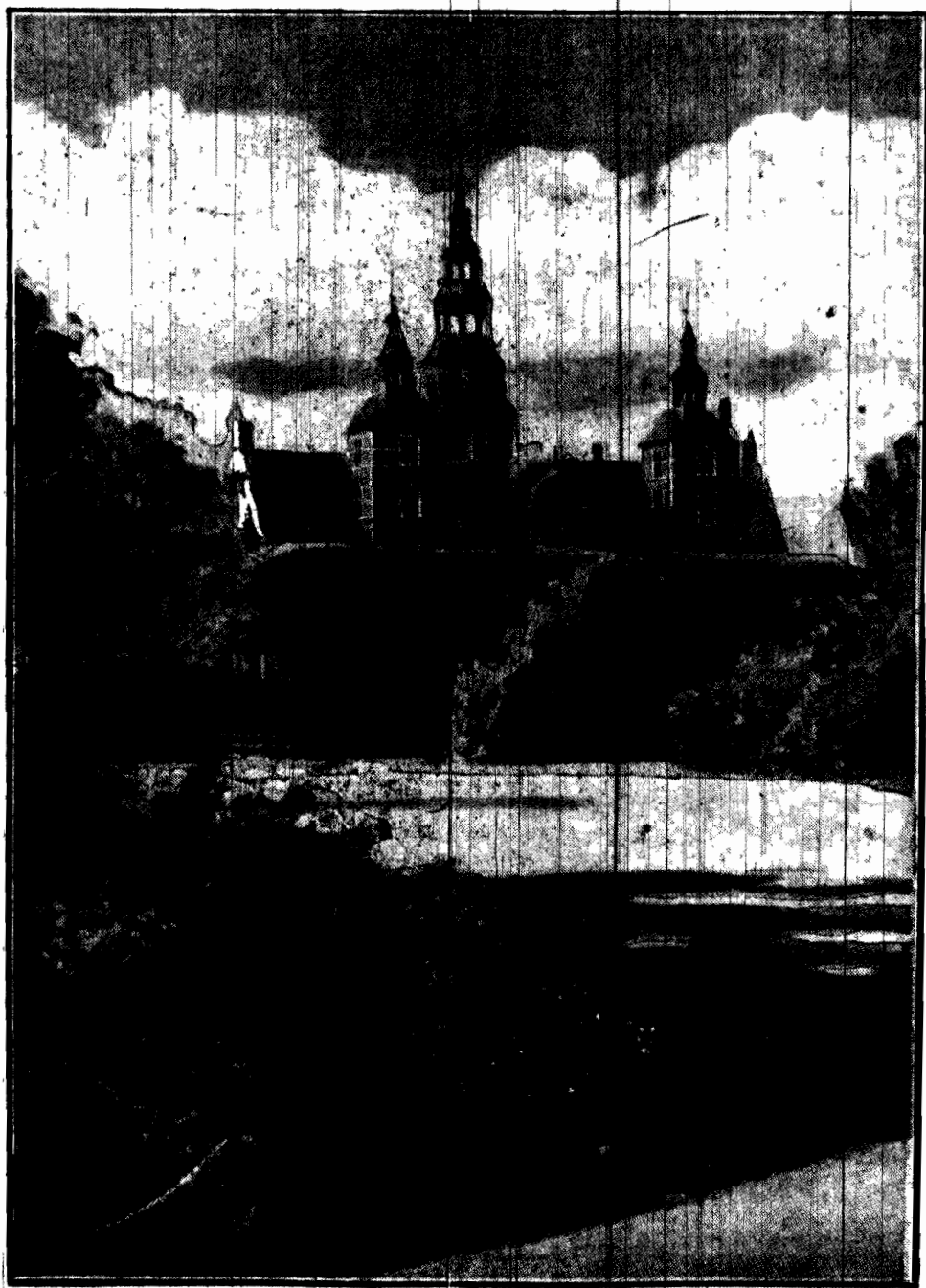
Fragment królewskiego parku w Kopenhadze z historycznym zamkiem „Rosenberg”.

Wielka ofensywa pracy i pokoju przed wyborami do parlamentu angielskiego