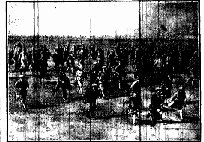
Grupa amatorów golfa, biegnie przez pola w ślad za piłką, rzucaną przez uwielbianego przez nich mistrza tego sportu