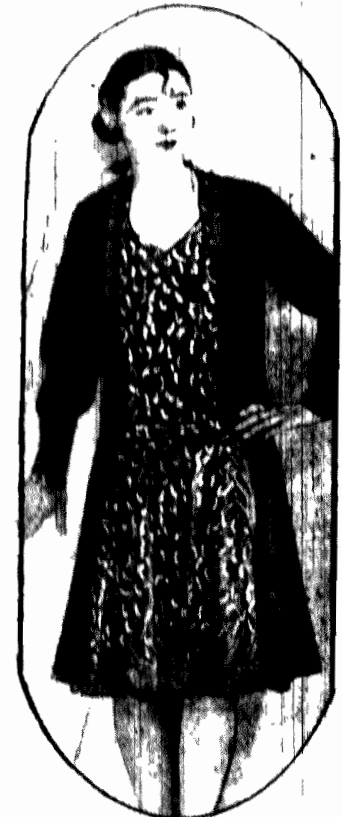
Przygodna sukienka płaszczyzny z masy cz- rnej i białego jedwabiu w Barwie Kwiaty. Szczęśliwie broniłki mogą za- trykować — zastawione — jak krakowskie Ławy

W piątek cały trybunał wraz z o- brofami i oskarżonymi udaje się sąpochodami do Nowego Targu, aby skonfrontować ciężko chorego Cornera z oskarżonymi.