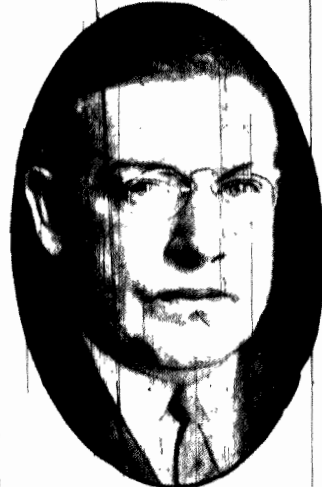
nowy ambasador Stanów Zjednoczonych w Paryżu, obejmuje swe stanowisko na początku września.