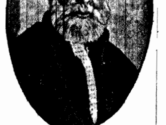
Musseln - Ibn Ali, były król Hedżazu, osadzony po detronizacji na wyspie Capri został zlicytowany za dług w wysokości 800 złotych.