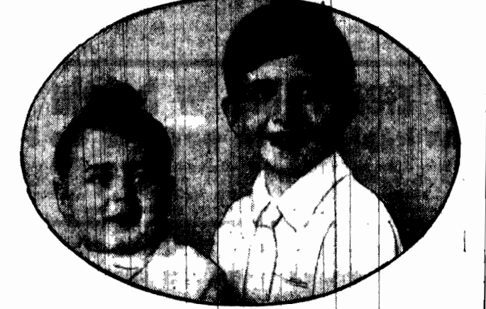
Ostatnie zdjęcie następcy tronu Jugosłowiańskiego ks. Piotra i jego brata ks. Tomisława.