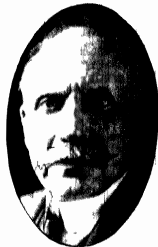
Nowy szef sztabu generalnego armii francuskiej, następca gen. Debeneva