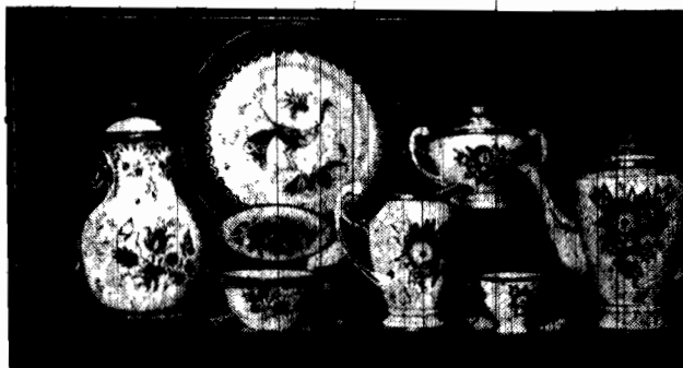
Prace p. Sobolewskiej z Warszawy, przeznaczone na wystawę w Poznaniu.