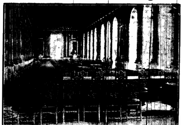
Dnia 7 maja minęło 10 lat od czasu rozpoczęcia pertraktacji pokojowych w Wersali. Oto sala w której podpisano traktat wersalski.