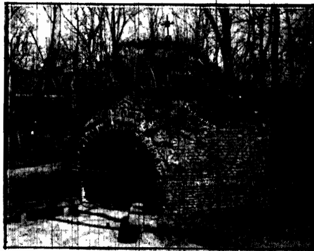
Historyczna kapliczka w ogrodzie Botanicznym po odpowiednim zrekonstruowaniu ma być zamieniona na mauzoleum, w którym złożone będzie serce Tadeusza Kościuszki.