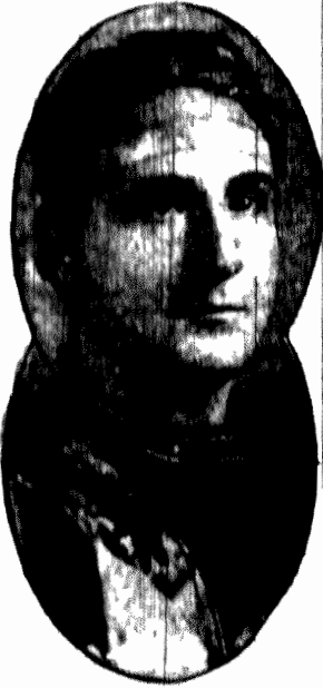
Giacomo Lauri Volpi, najdłuzszy tenor Włoch

Z fakto donoszą że władze sanitarne zametowały w ostatnim tygodniu kilka wypadków dżumy w Osaka.