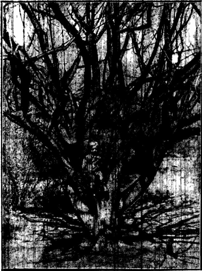
Małego chłopczyka posadzano w ogrodzie Botanicznym wśród konarów potężnego karłowatego drzewa. Jakże nikła wydaje się ta kruszynka wobec potężnych skrzęconych gałęzi.