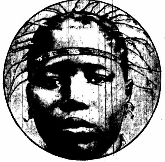
Przy stroju balowym.