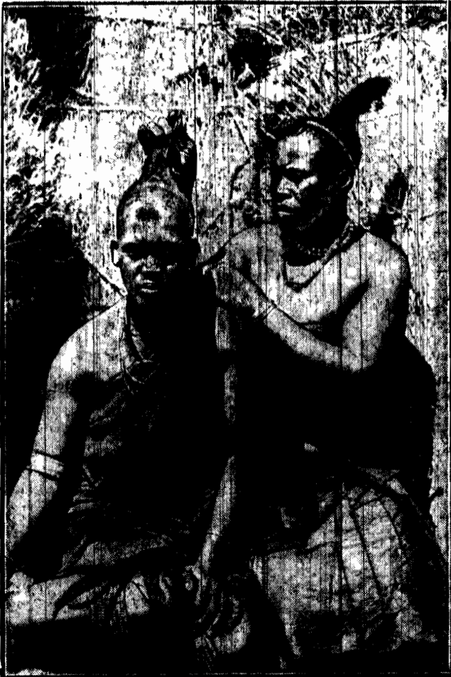
Zuluska piękność poddaje się skomplikowanym zabiegom miejscowego fryzjera, by pocić serca a młodych wsi.