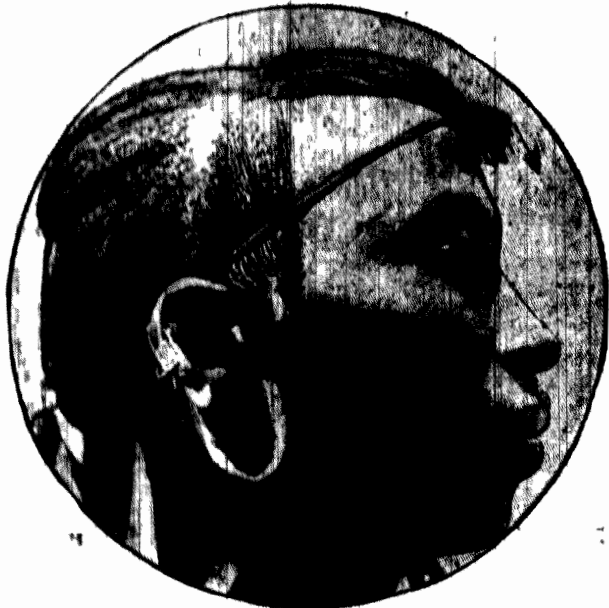
Na codzienny użytek.