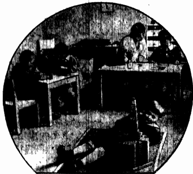
Podczas gdy mamusie robią zakupy w wielkim domu towarowym w Berlinie, dzieci pod opieką wyszkolonych nauczycielek bawią się w specjalnie do tego przeznaczonych salach.