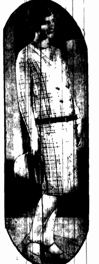
Suknia z wełny białej w ponsowa Krawczybrana skórka. Skrzyżowana i za pieta z przodu na wzór palta — jest to typowa sukienka spacerowa.