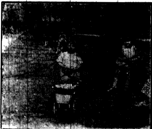
Często spotykamy się z podobnymi zamieszczonymi miłymi obrazkami zabaw dziecięcych.