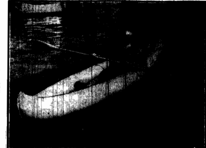
Wspaniały przyrząd dla miłośników sportu kajakowego.