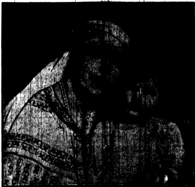
Krół Rumunii Michał I z babką swą królową - wdową.