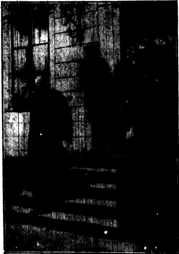
Wczoraj rano p. Prezydent Ignacy Mościcki wraz z ministrem Kwiatkowskim odczytał z podróży po Śląsku do Warszawy.