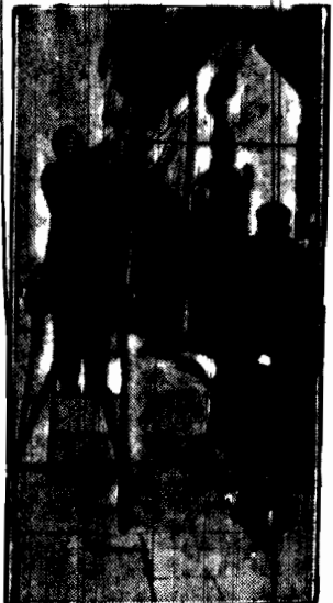
Zmieszane prawdziwe wiosenne słoneczko skłony zasłaniają okna wystawowe. Na zdjęciu widzimy zakładającą markizę przy ulicy Kruczej.