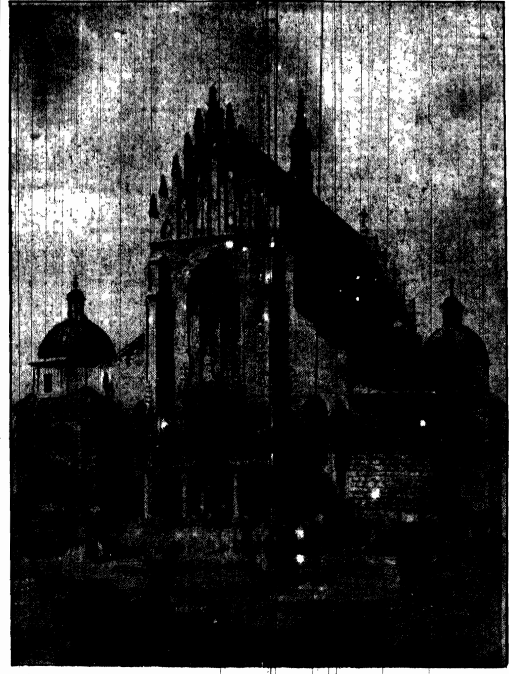
Kościół Dominikanów w Krakowie.