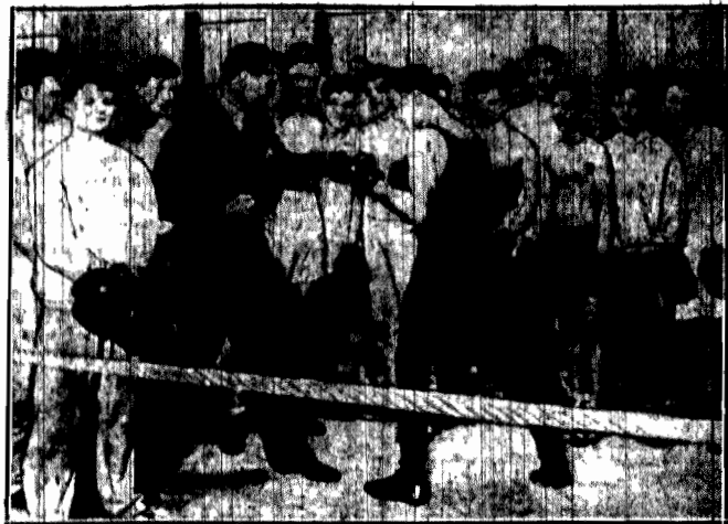
DEMPEY ZNOW TRENUJE Były mistrz świata rozpoczął już treningi, otrzymując je lekcyjami, udzielanymi bezpłatnie studentom amerykańskim.