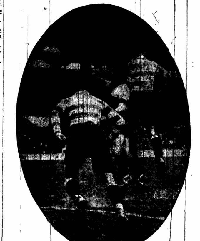
FINAL PIŁKARSKI FRANCJI Spotkanie finałowe o puchar francuski, rozegrane w Colombes (Paryż) między F. C. Gots i Montolier.