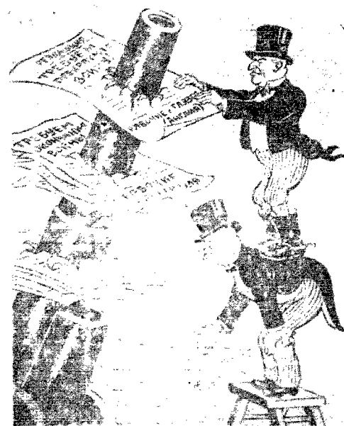
Angielscy zawodowi burokraci przy pracy. Rys. W. Lisiewicz.