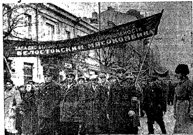
Kolumna robotników Białostockiego kombinatu mięsnego na demonstracji, poświęconej Uroczystości 22 rocznicy Wielkiej Październikowej Socjalistycznej Rewolucji.

skimi, przeznaczonymi do obrony brzegów. Jeden nieprzyjacielski samolot został strącony i zatonał, drugi zaś znacznie uszkodzony.