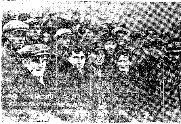
Goście — delegaci pracujących Zachodniej Białorusi — na trybunie rządowej w czasie defilady i demonstracji 7 listopada w Mińsku.

13 listopada, o 13 godzinie dalszy ciąg prac Sesji.