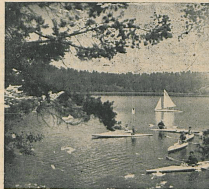
Na jez. Pomorze pod Sejnam, r. 1933.

Zastępcy powinien zorganizować wieczorki towarzyskie zastępu w domach prywatnych, by więcej związać członków.