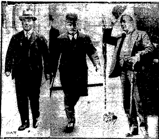
Jak wiadomo, konserwatyści w Anglii odnieśli niespodziewanie wielkie zwycięstwo w wyborach do parlamentu. Zdjęcie nasze przedstawia zwyciężonego lidera Labour Party, Artura Hendersona (na lewo), premiera Mac Donalda (w środku) oraz zwyciężycielę konserwatystów Stanley Baldwina (na prawo).