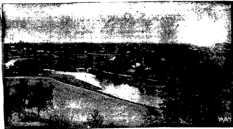
Miasto Korzec w woj. wołyńskiej, położone jest przy samej granicy bolszewickiej. Posiada dziś około 5000 mieszkańców. Dawniej było ono siedzibą ks. ks. Korońskich. W XVIII wieku posiadało sławną fabrykę porcelany, która zatrudniała przeszło 1000 pracowników. Zajęcie nasze przedstawia panoramę Korca nad rzeczką Korczykiem, która stanowi miejscami granicę polsko-sowiecką.