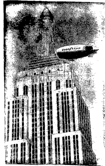
Ilustracja nasza przedstawia system, jakim pomyslowy dziennikarz amerykański rozwozi po Nowym Yorku pierwszy propagandowy numer swego wydawnictwa.