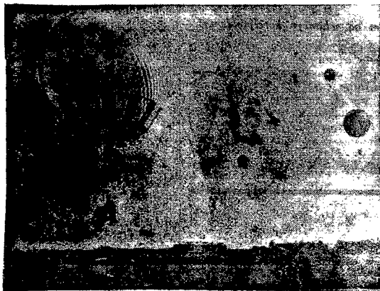
Na lotnisku Mokotowskim odbył się w ub. niedzielę start 8 balonów wolnych do raidu o puchar im. plk. Wankowicza. Na ilustracji naszej widzimy balon „Uniezo” na pierwszym miejscu oraz trzy inne balony na dalszym planie.