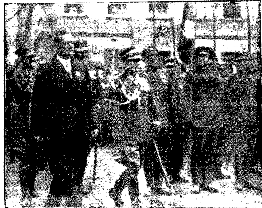
W Szamotułach, w W. Ks. Poznańskim, odbyło się wśród wielkich uroczystości poświęcenie sztandaru miejscowego Związku Strzeleckiego. Na ilustracji naszej widzimy wojewodę poznańskiego P. Raczyskiego, gen. Zaharskiego, plk. Dzygaja, odbierających raporty od oddziału Związku Strzeleckiego na rynku w Szamotułach.