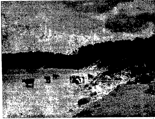
Okolice Augustowa. Jezioro Necko pod wieczór