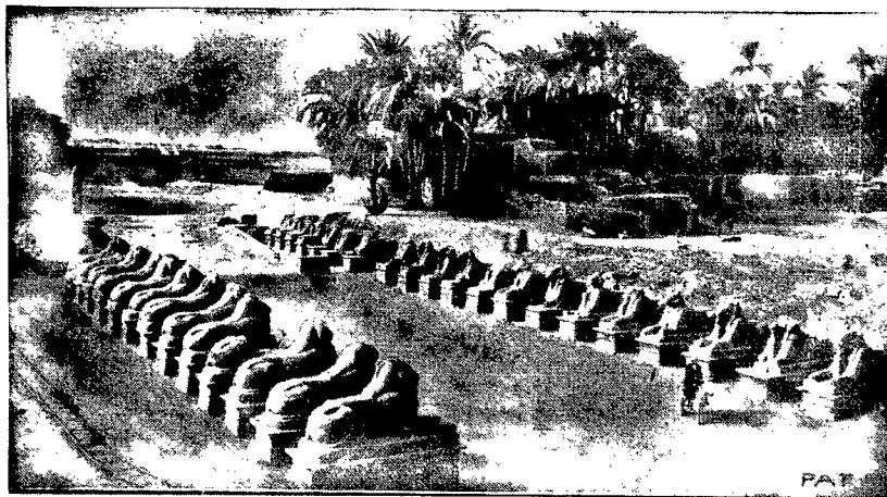
W Karnaku, w górnym Egipcie, gdzie liczne ruiny świątyni, zachowane do dzisiaj, świadczą wymownie o kulturze starożytnego Egiptu. Znajduje się słynna aleja sfinkswa, która prowadzi do rozpadającego się dziś pałacu faraona Ramzesa II. Po każdej stronie alei znajdują się 33 figury sfinkswa. Każda figura posiada 7 m. wysokości i 12 m. długości.