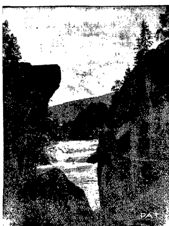
Piękno ziemi Polskiej

Do najpiękniejszych części ziem Polski należy Miłopolska Wschodnia, a zwłaszcza jej okolice podkarpackie, nad Prutem i Czeremoszem. Na ilustracji naszej widzimy piękny wodospad Prutu, t. zw. Perenoj lub Huk, pod wzgórzem Pohar. Wodospad ten szkodliwie silnie uszkodzony przez przemysłowców drzewnych, dla ułatwienia solawu frakt, robi jednak mimo to, w otoczeniu wysokich, gęsto zalesionych gór majestatyczne wrażenie.