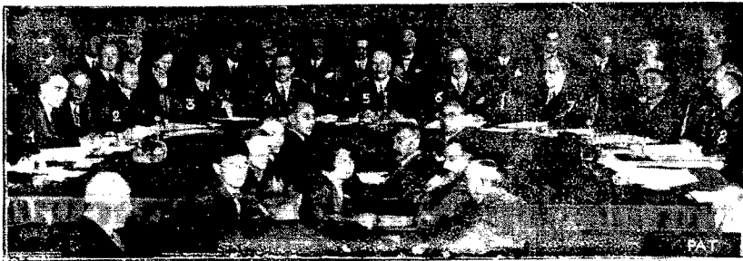
Dnia 1 września o godz. 11-ej przedpołudniem otwarto w pałacu Ligi Narodów w Genewie obrady wrześniowej sesji Rady Ligi Narodów. Obradom przewodniczył hiszpański minister Spraw Zagranicznych Lerroux. Na ilustracji naszej widzimy od strony lewej do prawej: czeskosłowackiego ministra Spraw Zagranicznych dr. Benesa, (1), ministra Spraw Zagranicznych Rzeszy Niemieckiej Curtiusa (2), ministra Spraw Zagranicznych Italii Grandiego (3) delegata francuskiego Masigli'ego (4), przewodniczącego obrad, hiszpańskiego ministra Spraw Zagranicznych Lerroux (5) sir Erica Drummonda, generalnego Sekretarza Ligi Narodów (6), delegata Wielkiej Brytanji lorda Cecila (7) i polskiego ministra Spraw Zagranicznych A. Zaleskiego (8).