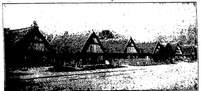
Wieś Wolkowe (pow. ostrołęcki). Dymy, ku piwońskie