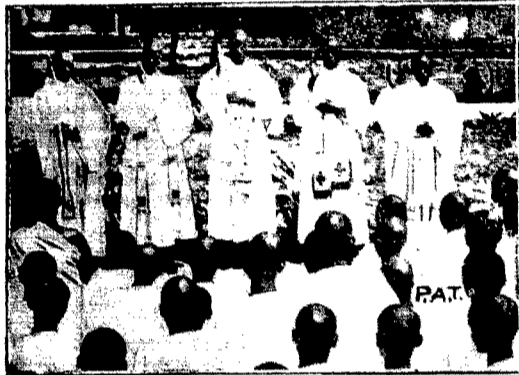
Seminarjum duchowne św. Karola w Ruanda w Afryce Centralnej, wyszło w ostatnich dniach 23 czarnych kapłanów do prowincji Ruanda i Urundi, stanowiących belgijskie terytoria mandatowe w Centralnej Afryce. Na ilustracji naszej widzimy pięciu czarnych kapłanów udzielających błogosławieństwa wychowankom seminarjum duchownego w Ruanda.

Kapłani-murzyni udzielają błogosławieństwa