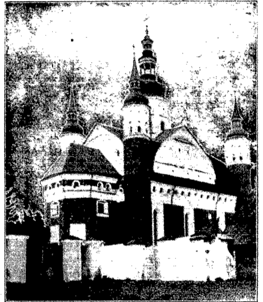
B. kościół obrony O O B. i J. w p. XVI w. w Strzeżu (pow. białostocki)