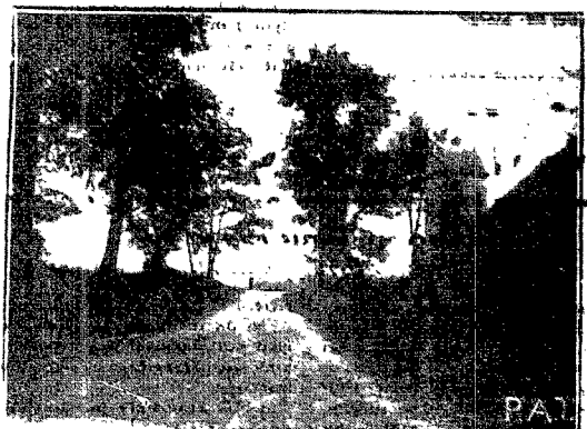
Wśród licznie rozrzuconych po Malopolsce starych budowli, wyróżnia się malowniczym położeniem zamek w Złoczowie, wybudowany w XVII w. przez Siemlenskich, wzmożony fortyfikacjami przez Jana Sobieskiego. Zdjęcie nasze przedstawia drogę z prawej strony jeana z obronnych wierzanku