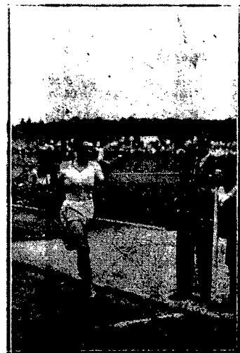
Podczas międzynarodowych zawodów lekkoatletycznych w Charlottenburgu, znakomity biegacz francuski Ladoumègue ustanowił nowy rekord w biegu na 1000 m. mianowicie 2 min. 25,3 sek. Na zdjęciu Ladoumègue przybawający do mety.

nia swoich zapasów potrzebnych dla wyprawy podbiegunowej. Dalszy start ma nastąpić niedługo, gdyż pogoda jest sprzyjająca. Stan załogi jest bardzo dobry. Wszyscy przekonani są, że lot tak szczęśliwie rozpoczęty zostanie również szczęśliwie doprowadzony do końca.