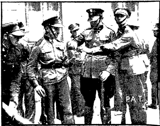
W czasie odbywającego się w Warszawie tygodnia oszczędności dyrekcja P. K. O. ofiarowała wszystkim członkom kompanji honorowej Federacji Obronców Ojczyzny skarbonki, aby w ten sposób propagandować oszczędność wśród organizacji. Zdjęcie nasze przedstawia moment, gdy federaci po otrzymaniu skarbonek wzajemnie zapoczątkowują sobie oszczędności.