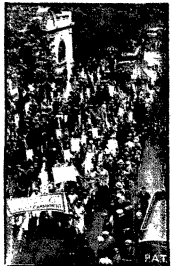
Podczas wielkich manifestacji pokojowych w londyńskim Albert Hall'u przez miasto przesyłał pochód, manifestujący transparentami i okrzykami potrzebę utrzymania pokoju i powszechnego rozbrojenia. Nasze zdjęcie przedstawia fragment pochodu, a mianowicie grupę delegatek Międzynarodowej Ligi Kobiet, niosące transparent z napisem: „Międzynarodowa Liga Kobiet jest za powszechnym rozbrojeniem”