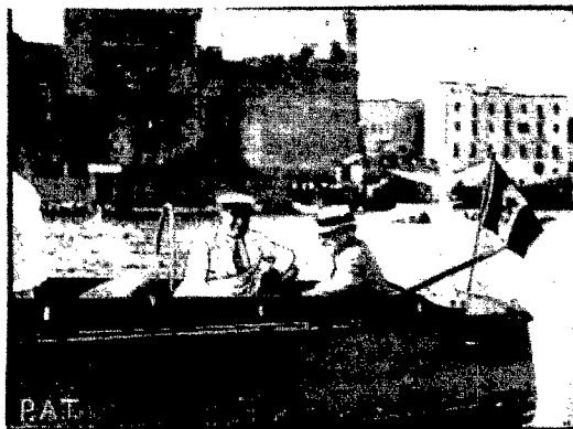
Podczas swego pobytu w Rzymie, amerykański sekretarz stanu Stimson, spędził wycieczki w zamku włoskiego ministra spraw zagranicznych — Grandego w Sangello. Pewnego popołudnia zjawili się tam Mussolini, który przybył łodzią motorową i zaprosił amerykańskiego męża stanu na parogodzinną przejażdżkę. Zdjęcie przedstawia Mussoliniego w łodzi motorowej w towarzystwie Stimonsa.