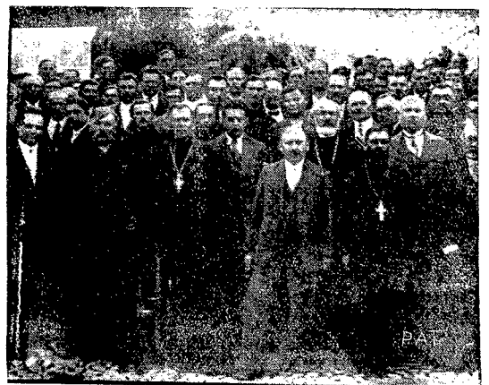
W Lucku w sali ukraińskiego stowarzyszenia zwanego „Ridna Chata” odbył się kongres Wołyńskiego Ukraińskiego Zjednoczenia. Na ilustracji widzimy duchownych wyznania prawosławnego oraz osoby świeckie, biorące czynny udział w kongresie.