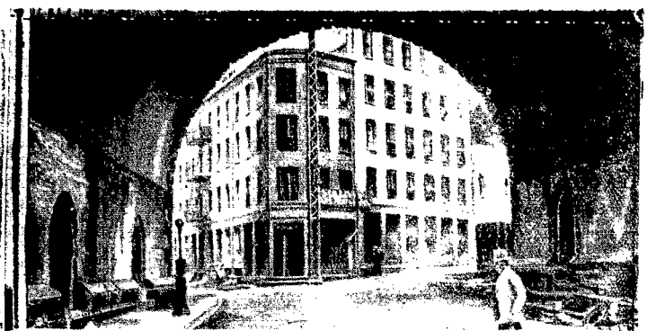
Blaski i nędze New Yorku

Obok blizujących pałaców miasta wszystkich ludów, jakim jest New York, tak się często nie przez wszystkich zauważona nędza. Ilustracja powyższa przedstawia widok z pod mostu Brooklyńskiego na Dom Biednych, z pomocy którego korzystają często niezamożni reemigranci.