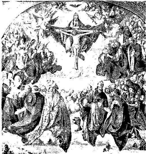
Zabytkowy obraz, malowany przez Albrechta Dürera.