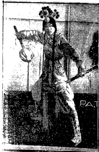
Oto jeden z egzotycznych szczegółów japońskiego teatru, artysta grający rolę kobiety, dwa warczce opadające prawie do ziemi świadczą o młodym wieku grającej osoby.

świadkami takich pożegnań, nie mogli ukryć swego wzruszenia.