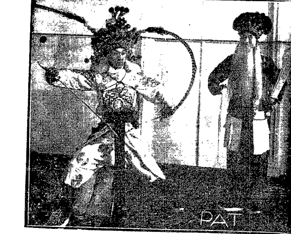
Japońska sztuka teatralna, stojąca na wysokim poziomie artystycznym, wymagająca od aktora nie tylko umiejętnej gry, ale i cyrkowej wprost akrobacji, posiada również wiele cech specyficznych, dla nas europejczyków zupełnie niezrozumiałych i tak, naprzykład: uwidocznieni na naszej ilustracji dwaj aktorzy grający rolę wojowników, dzięki charakterystyce posiadają zupełnie różne cechy i charakterystyki uwidocznione na zewnątrz. Wojownik na pierwszym planie jest barbarzyńcą (podkreślają pióra barżancie) w młodym wieku (młodość — znamienne liście futro kolo szyji). Ponieważ wojownik z prawej strony posiada bardzo długą siwą brodę, musi więc mieć lat — od 70 do 80.

W związku z powyższym posiedzeniem jest spodziewane, że pierwsza połowa transzy, pożyczki francuskiej na budowę kolei Górny Śląsk — Bałtyk w wysokości 165 milionów franków franc. wpłynie około 28 b. m. do Piłski. II połowa tej transzy w takiej samej wysokości wpłynie około 20 lipca r. b. Natychmiast po powiększeniu w ten sposób funduszu na budowę linii kolejowej wzmoże się tempo budowy, zwiększy się zapas materiałów budowlanych i powiększy się liczba, zatrudnionych przy budowie, robotników.