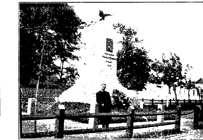
Pomnik Romualdowi Trauguttowi w Świsłoczy.