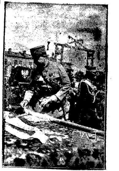
Uroczystość wręczenia 44 i 45 pułkowi piechoty sztandarów od miast Paryża i Verdun rozpoczęła się apelem połowym po którym pułki oddały honory starym sztandarom niegdyś wręczonym im na polach Francji przez prezydenta Poincarę; dziś przeznaczono je do muzeum wojska. Po poświęceniu sztandarów przed biskupa połowego as. Gailla i po wzięciu gwoździ przez reprezentantów rządu, przedstawicieli ambasady francuskiej, delegatów Paryża i wyższych oficerów. W imieniu Pana Prezydenta general Komier wręczył sztandary dowódcom pułków. Na ilustracji — szef misji francuskiej gen. Denain przypina szarfę do sztandaru 45 p. na prawo — po przypięciu szarfy — odchodzi gen. Komier