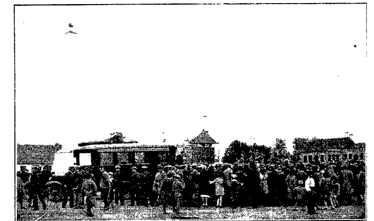
Kolumna pamiątkowa na rynku w Świsłoczy. Obok autobus Misji Barbikańskiej i tłum ludności żydowskiej, która wysłuchuje przemówienia misjonarza.

W początkach ubiegłego stulecia, słynęła Świsłocz nie tylko z gimnazjum.