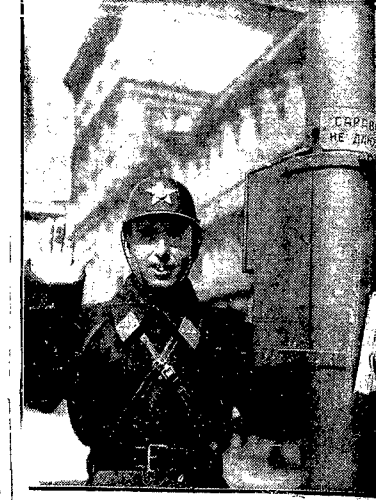
Ilustracja nasza przedstawia policjanta kierującego ruchem ulicznym, któremu nie wolno z nikim rozmawiać, tak bowiem głosi tabliczka umieszczona obok niego.