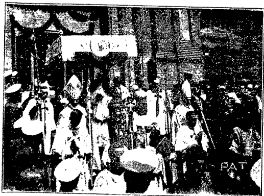
W jednodniowym kongresie eucharystycznym w Białymstoku bardzo licznie uczestniczyła ludność Białegostoku i okolic. Na tę uroczystość, przybył z Wilna ordynariusz archidiecezji wileńskiej J. E. ks. arcybiskup Jabrzykowski. Na ilustracji widzimy fragment procesji z J. E. arcybiskupem Jabrzykowskim w chwili wyjścia z kościoła Farnego.