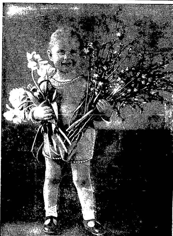
Minął „Tydzień Dziecka”. Kto mógł, złożył ofiarę na umilenie życia maluchom, ponadto urządzono szereg imprez dziecięcych. Jednak akcja opieki nad dzieckiem nie powinna zakończyć się „Tygodniem”, ale winna trwać cały rok. Niech wszystkie dzieci polskie mają się tak, jak to, które przedstawia nasza ilustracja.

WARSZAWA, 5. VI. Sędzia apelacyjny, który do spraw szczególnej wagi p. Demand w ciągu dnia dzisiejszego i jutrzejszego przesłuchuje byłych więźniów brzeskich w związku z rozprawami przeciwko nim śledczym o akcje wywrotowe.