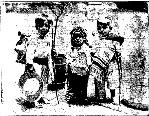
W Meksyku, w myśl tradycji, podczas uroczystości kościelnych bierze udział w procesjach najmłodsze pokolenie obywateli, przybranych w barwne stroje ludowe.