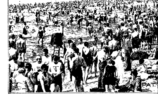
W skwarnych promieniach słońca

Na zebraniu giełdy zbożowo-towarowej w Warszawie obroty były małe przy tendencji utrzymanej. Notowano za 100 kg. paryteł wagon Warszawa w handlu hurtowym w ładunkach wagonowych: żyto 29 i pół—30, przenica 35—36, owies jednocioty 33—34, owies zbierany 31—32, jęczmień na kaszę 28—28 i pół, browary—bez obrotów, mąka pszenna luks. 64—74, otreby pszenne szale 21—22, otreby pszenne średnie 20—21, otreby żytnie 20—21, kuchy lniane 31—34, kuchy rzepakowe 26—27, groch polny jadalny 32—35, groch „Victoria” 40—45, łubin niebieski 22—23, łubin żółty 30—32, ziemniaki jadalne 9—10.