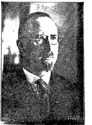
W nowoutworzonym gabinecie tekę ministra Skarbu powierzono dotychczasowemu wice-marszałkowi Sejmu Janowi Piłsudskiemu.

WARSZAWA. Według danych P. U. P. 30. liczba bezrobotnych w Polsce w dniu 30 maja br. wynosiła 320.109 osób, co w porównaniu ze stanem z poprzedniego tygodnia (23 maja) wykazuje spadek bezrobocia o 10.084 osoby. Jest to najmniejszy spadek bezrobocia, jaki zanotowano dotychczas w ciągu bieżącego sezonu.