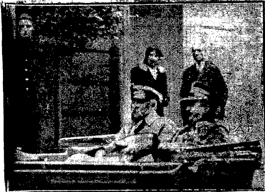
Pan Marszałek Józef Piłsudski wraz z małżonką i córeczkami zaszczylił swą obecnością teatr dla dzieci „Jaskółka”, mieszczący się w Łazienkach w Starej Pomarańczarni. Na scenie grana była bajka Collodiego p. t. „Pinokio”. Na ilustracji widzimy Pana Marszałka, opuszczającego po przedstawieniu Starą Pomarańczarnię.