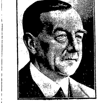
Angielski Minister Spraw Zagranicznych, Henderson, został powołany przez Ligę Narodów na przewodniczącego Konferencji Rozbrojeniowej, która odbędzie się w r. 1932.

nieświadomie pracuje na rzecz komunizmu. Bo ten kto dziś wytyka rządowi kryzys gospodarczy, podburza urzędników z powodu obciążenia 15% podatku, robotników z powodu bezrobocia, rolników z racji niskich cen — ten wytwarza atmosferę najbardziej sprzyjającą robocie komunistycznej.