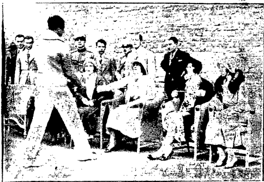
W Belgradzie na międzynarodowym turnieju tenisowym zwycięstwo odniósł książe Konstanty. Na ilustracji widzimy królową Marię, winszującą księciu Konstantemu zwycięstwa.

Po ogólnej dyskusji, przeprowadzonej nad sprawozdaniem Dyrekcji w pierwszym dniu obrad, wyłoniono dwie komisje, które na szeregu posiedzeń zajęły się szczegółowym rozpatrzeniem sprawozdań i wniosków.