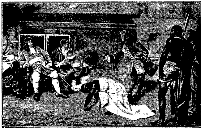
Przed 250 laty, w maju, na pokładzie brandenburskiego okrętu wojennego „Morlan”, zakotwiczonego w wybrzeży Gwinei zostało zawarte przymierze handlowe z władcą murzynskim kraju. Rycina powyższa, podług obrazu H. Klementza, przedstawia hold władcy murzynskiego szczepu Janke przed wielkim księciem Brandenburskim.