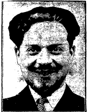
włoski minister rolnictwa, który za zasługi, położone na polu rolnictwa otrzymał w tych dniach złoty medal T-wa Geograficznego.