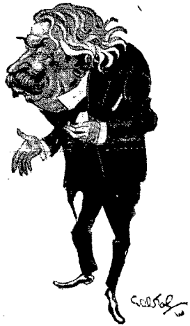
Aristydes Briand w karykaturze

wrażliwa one bowiem z natury dzisiejszego Francuzi i odczuwania przez swoich interesów.