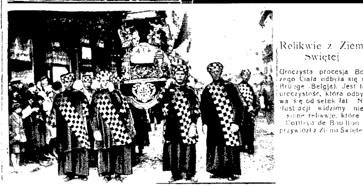
Relikwie z Ziemi Świętej

Białe zęby Europejczyka sa tu wymiانية i przewyżwane „psiemymi zębami“.