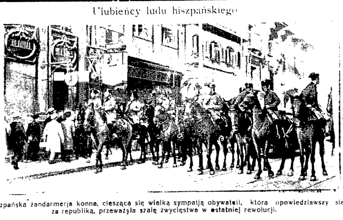
Ułubieńcy ludu hiszpańskiego